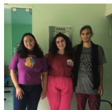
Figura 1-Visita ao CRAS Santo Antônio-Tiangua