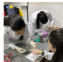
Figura 2 Sendo realizado a Tipagem sanguínea