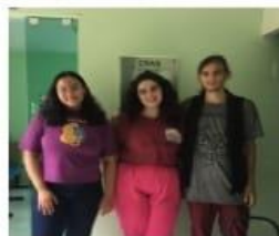
Figura 1-Visita ao CRAS Santo Antônio-Tianguá