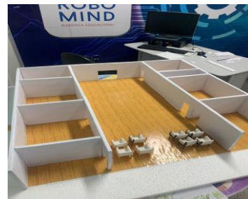
FIGURA 3: Representação esquemática da estrutura base da maquete.

O projeto em questão, proporcionou aos envolvidos uma troca de conhecimentos multidisciplinares diversos abrangendo áreas do conhecimento como: fisioterapia, gestão em geral, gestão em saúde e engenharia, promovendo uma interação única entre os cursos bem como agregando conhecimento voltado para o empreendedorismo de forma teórica e prática. A partir deste, foi concedido aos alunos uma visão expandida da vivência profissional além da vida acadêmica, e um melhor preparo profissional para a realidade do mercado de trabalho.