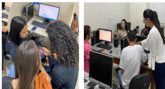
FIGURA 1 e 2: Representação de alguns dos encontros entre discentes e docentes na elaboração e organização do plano de negócios.

Após quatro meses de pesquisa e extensão de conhecimento interdisciplinar, foi consolidada a clínica privada especializada em serviços bucomaxilofaciais Physio Face, dispondo de um plano e projeto de negócio, planta baixa e confecção da maquete. Todas as etapas foram minuciosamente estudadas, tendo como base quesitos substanciais como mercado de trabalho, valores, capital a ser investido, necessidades da região em que se insere, vantagens e desvantagens em geral. Como resultado a empresa foi aberta, seguindo todos os princípios de cunho administrativo, técnico, estrutural, sanitário e de gestão; Contando com proprietários, corpo administrativo e demais colaboradores.