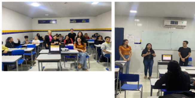
PALESTRA SOBRE BULLYING APRESENTADA NA ESCOLA TANCREDO NUNES DE MENEZES NO DIA 15/06/2023, NO TURNO DA NOITE PARA TURMA DE 22 ALUNOS DO 1º ANO DO ENSINO MÉDIO.