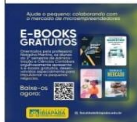
(imagem 01: Folder promocional)

A sala foi dividida em equipes e cada uma criou um formulário na ferramenta google formulário com dez perguntas pertinentes aos seguinte temas: formas inovadoras de pagamento, comunicação via whatsapp business, tendências de mercado e estratégias de marketing. O questionário foi enviado via whatsapp para grupos de pessoas que frequentam pequenos negócios. Esse questionário foi criado até o dia vinte e um de abril e distribuído até o dia cinco de maio.