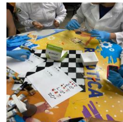
Figura 3 Treinamentos em sala de aula, professor e discentes de fisioterapia.