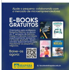
Imagem 01: Folder promocional

A sala foi dividida em equipes e cada uma criou um formulário na ferramenta google formulário com dez perguntas pertinentes aos seguinte temas: formas inovadoras de pagamento, comunicação via whatsapp business, tendências de mercado e estratégias de marketing. O questionário foi enviado via whatsapp para grupos de pessoas que frequentam pequenos negócios. Esse questionário foi criado até o dia vinte e um de abril e distribuído até o dia cinco de maio.